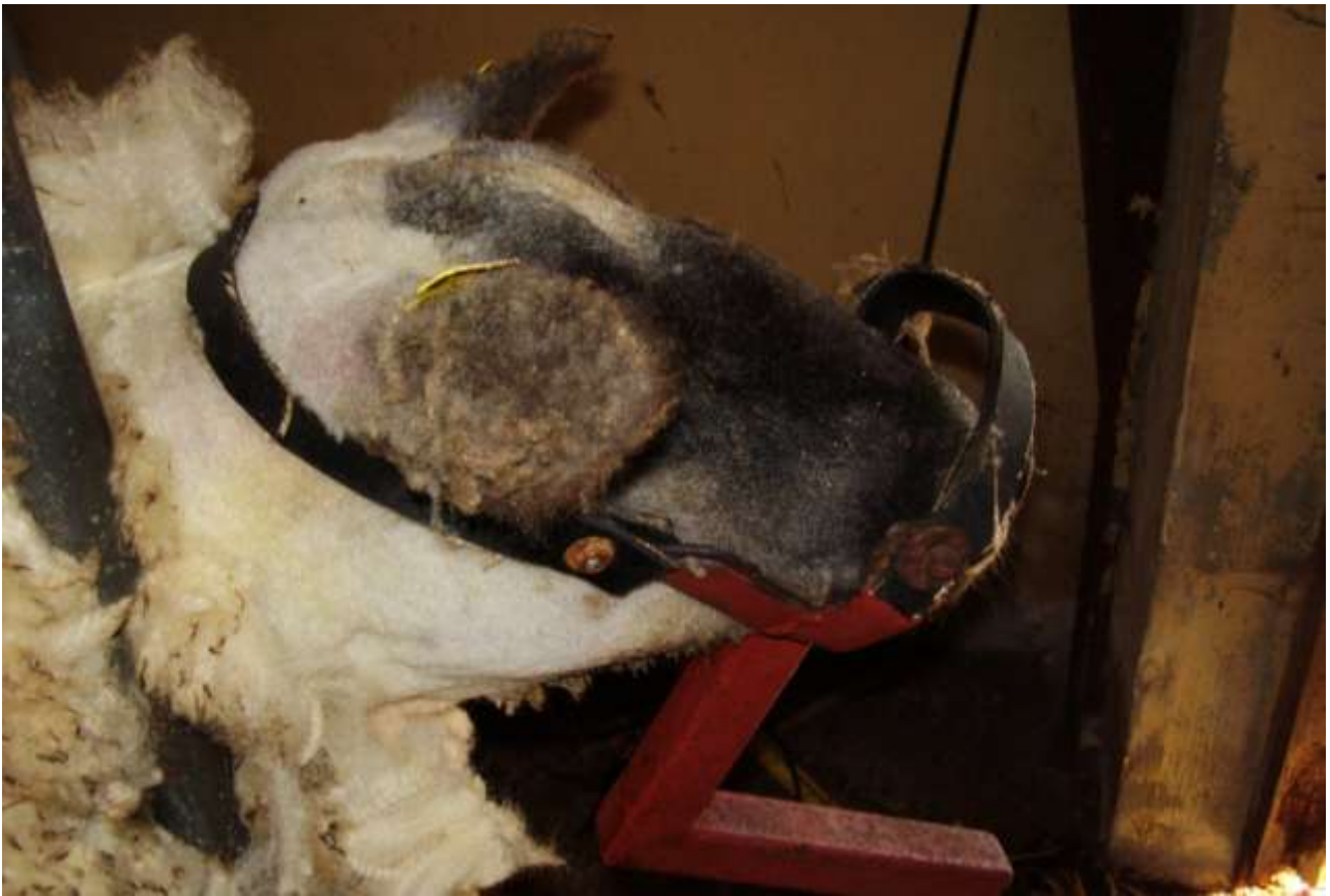
Fig: 5 Hoved er klippet, hovedholderen sættes på før halsklemmen løsnes.