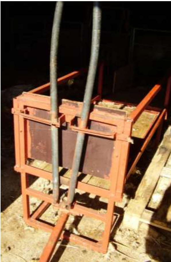
Fig: 1 Klippebænken set forfra med halsklemme.