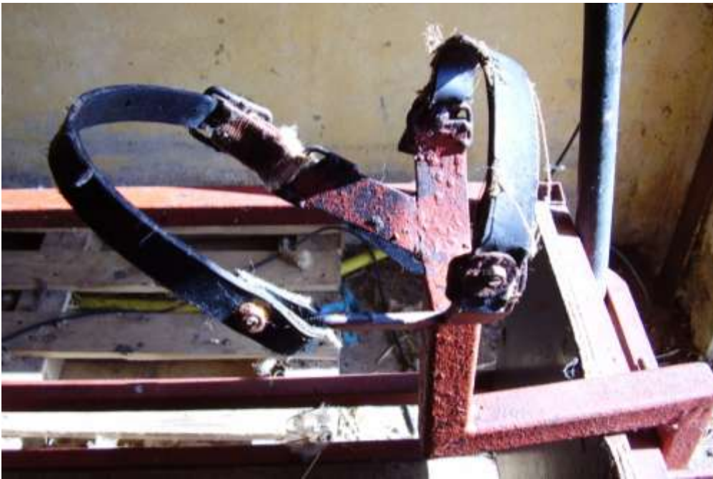
Fig: 3 Hoved holderen.