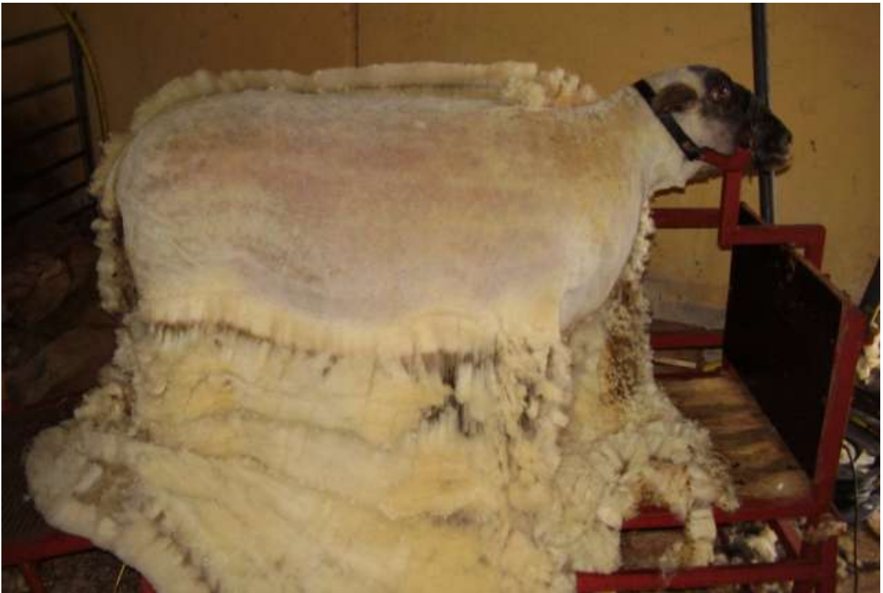
Fig 7 Klar til at klippe under maven.