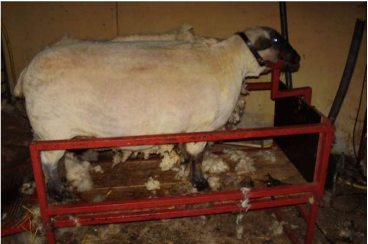
Fig: 8 Første side klippet, sidegelænder slået op, klar til at klippe side to.