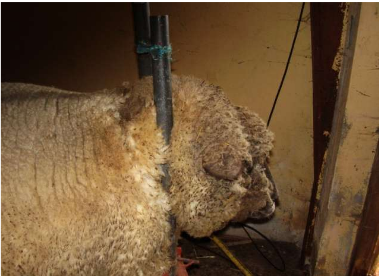
Fig: 4 Hals klemmen er lukket, fåret kan klippes i hovet .