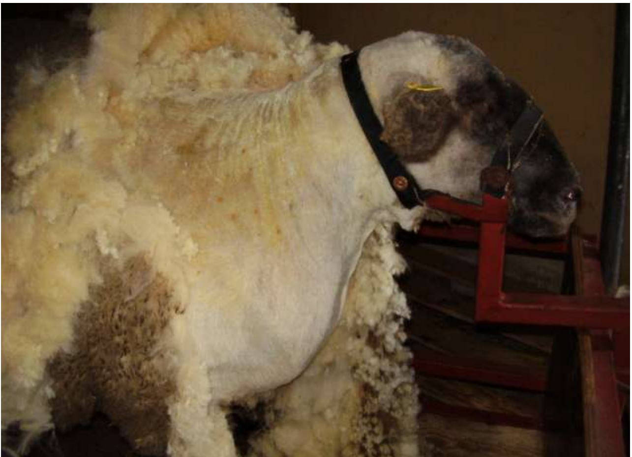
Fig: 6 Bryst og bov er klippet.