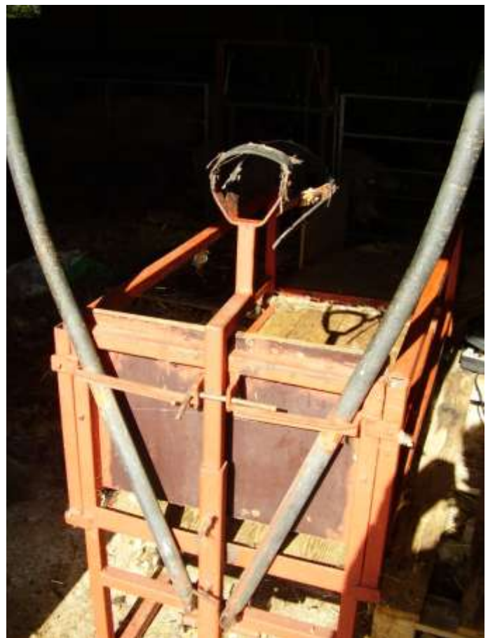
Fig: 2 Klippebænken set forfra med hovedholder